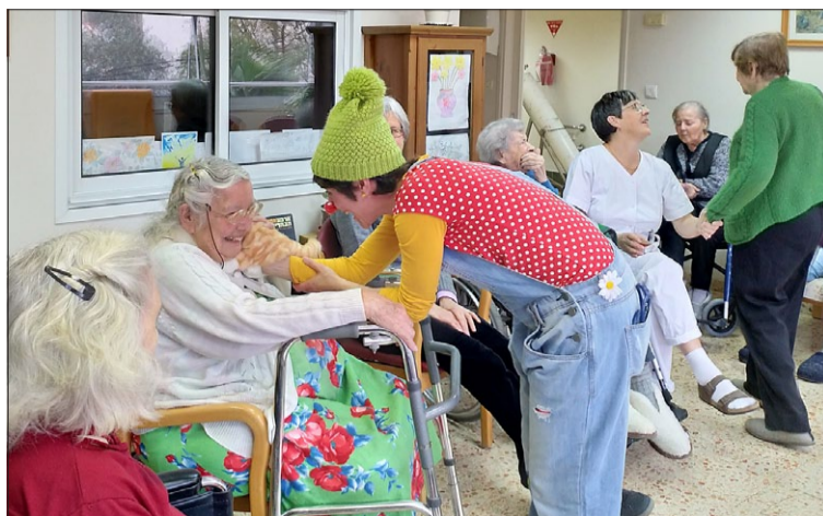
Ebenezer-koti, Haifassa on toiminut holokaustista selvinneiden vanhusten hoivakotina vuodesta 1976 alkaen.

avaa selkeän ja todellisen näkökulman taivaan todellisuuteen ja kuoleman jälkeiseen elämään. Saan valtavasti rohkeutta, kun näen miten vanhukset ylistävät Luoja, luottavat Häneen ja kaipaavat Hänen luokseen. Jesajan sanoin (46:4): Teidän vanhuutenne päiviin saakka minä olen sama, vielä kun hiuksenne harmaantuvat, minä teitä kannan. Niin minä olen tehnyt ja niin yhä teen, minä nostan ja kannan ja pelastan.