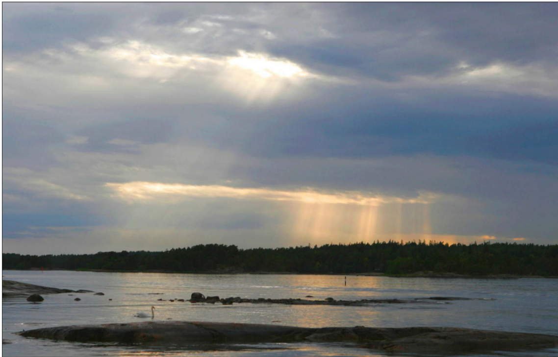
Helluntai, Pyhän Hengen vuodattamisen päivä kuuluu pääsiäisen ja joulun ohella kirkkovuoden kolmen suurimman juhlan joukkoon. Ensimmäinen helluntai oli kristillisen kirkon perustamisen päivä, kirkon syntymäpäivä.

Kun oli kulunut 40 päivää pääsiäisestä, Jeesus oli Opetuslastensa kanssa aterialla. Hän kehotti opetuslapsiaan pysymään Jerusalemissa; ”Älkää lähtekö Jerusalemissa, vaan jääkää odottamaan sitä, minkä Isä on teille luvannut ja mistä olette minulta kuulleet. Johannes kastoi vedellä, mutta teidät kastetaan Pyhällä Hengellä. Siihen ei ole montakaan päivää.” Te saatte voiman, kun Pyhä Henki tulee teihin, ja te olette minun todistajiani Jerusalemissa, koko Juudeassa ja Samariassa ja maan ääriin saakka.”