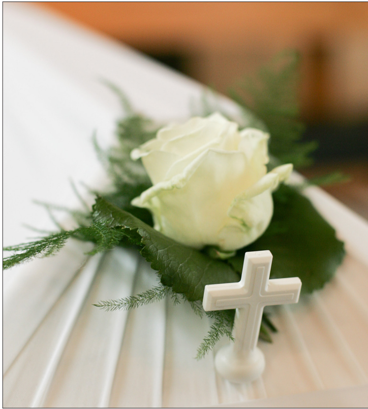
Omaiselle läheisen kuolema on ainutkertainen tapahtuma. Hautajaisten järjestämisessä on omaisilla monta asiaa hoidettavana.

Siunaava pappi ottaa yhteyttä omaisiin kun hautajaisvaraus on tehty ja sopii hautajaisista lähiomaisten kanssa yleensä noin viikkoa ennen hautajaisia. Tapaaminen voidaan sopia seurakunnan tiloihin tai surukotiin. Vallitsevassa pandemiatilanteessa kes-