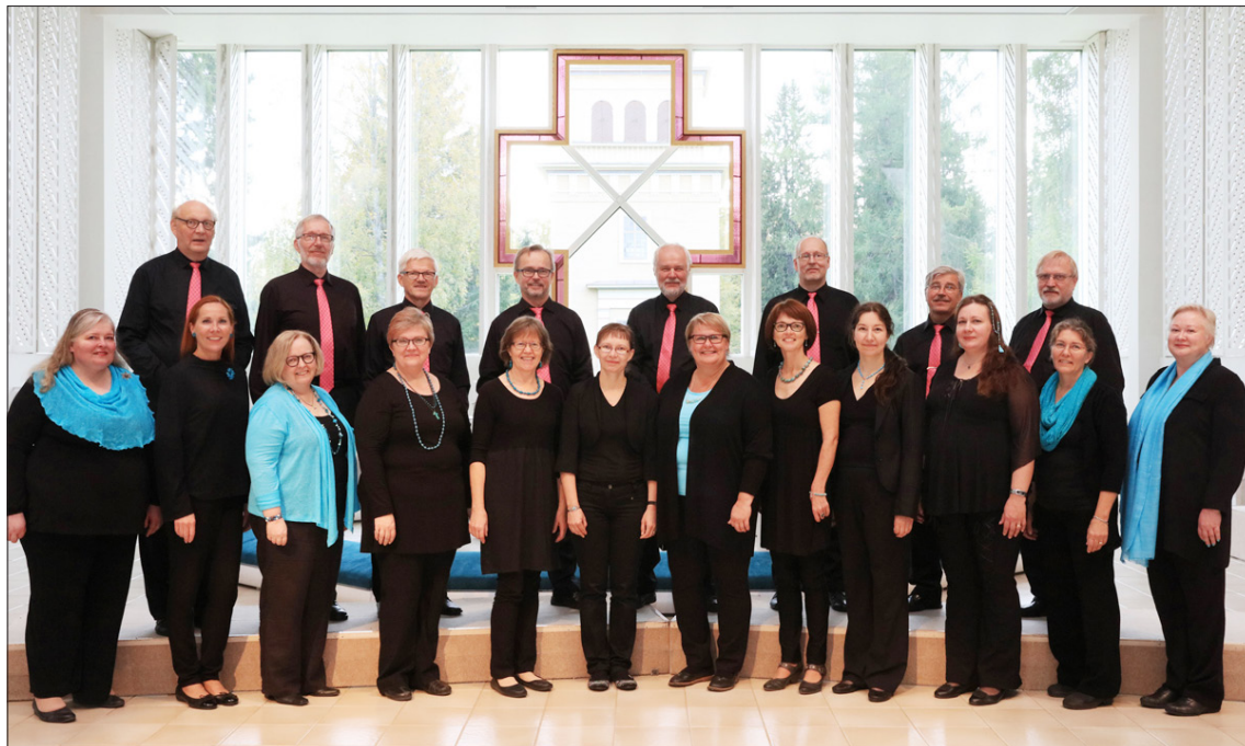
Braxén-kuoro konsertoi lauantaina 18. 5. klo 18 Kuhmon kirkossa.

Millaista musiikkia Braxén-kuoro sitten laulaa? Monelle kuoroa kauan seuranneille Braxén-kuoron nimi saattaa tuoda mieleen vapaakirkollisen säveltäjän Mika Piiparisen hienot