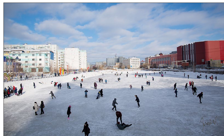
Itä-Siperiassa on luistelukausi varsin lyhyt, sillä jo huhtikuun alussa alkaa talviliikuntakausi päättyä.

Päivisin hion venäjän taitoani kieliopintoihin ja yritän myös takoa sahan kieltä päähäni. Sanontojen sananmukaiset käännökset ihmettyvät. Säästä puhuttaessa kuvaillaan taivasta, esimerkiksi pakastuessa taivas kylmenee. Vihrää ja sinistä tarvoittava sana on sama, tarvittaessa lisätään eteen "ruoho" tai "taivas" selventämään, kummasta väristä on kyse. Olen yrittänyt päästä ruskean värin käsitteestä selville. Jos sinistä ja vihreää varten on vain yksi sana, ruskeaa varten ainakin kolme. Yksi tarkoittaa lehmän ruskeaa, toinen jonkin linnun väriä ja kolmas vielä jotain aivan muuta. Välillä menen harjoittelemaan kielitaitoa elokuviin. Dokumentti, joka kuvasi hevosen kasvatta-