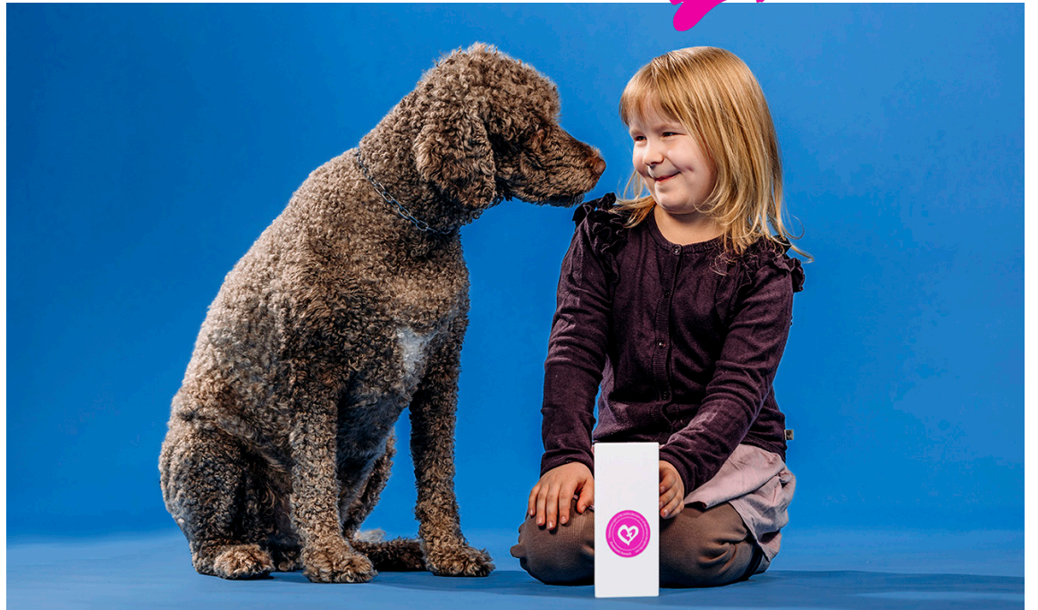
Vuoden 2024 Yhteisvastuu kutsuu auttamaan yhdessä toimien yksinäisiä, syrjäytyneitä tai kriisin kohtanneita nuoria Suomessa ja maailmalla.

20 % keräystuotosta käytetään HelsinkiMission työhön, jolla autetaan yksinäisiä nuoria tarjoamalla kriisi-