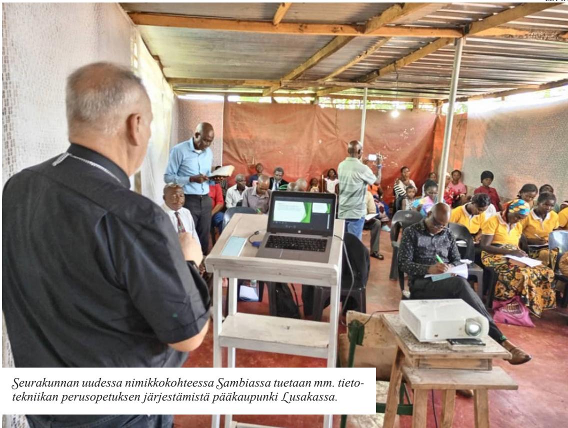
Seurakunnan uudessa nimikkokohteessa Sambiassa tuetaan mm. tietotekniikan perusopetuksen järjestämistä pääkaupunki Lusakassa.

K uhmon seurakunta ja Evankelinen lähetysyhdistys – ELY ry ovat tehneet sopimuksen Sambiassa toimivan LTCS koulun tukemisesta.