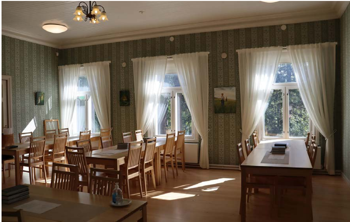
Ikolan pappilan viihtyisät tilat soveltuvat niin kokouskäyttöön kuin perhejuhlien järjestämiseen. Tilojen vuokraamisesta ja varaustilanteesta voi tiedustella kirkkoherranvirastosta.