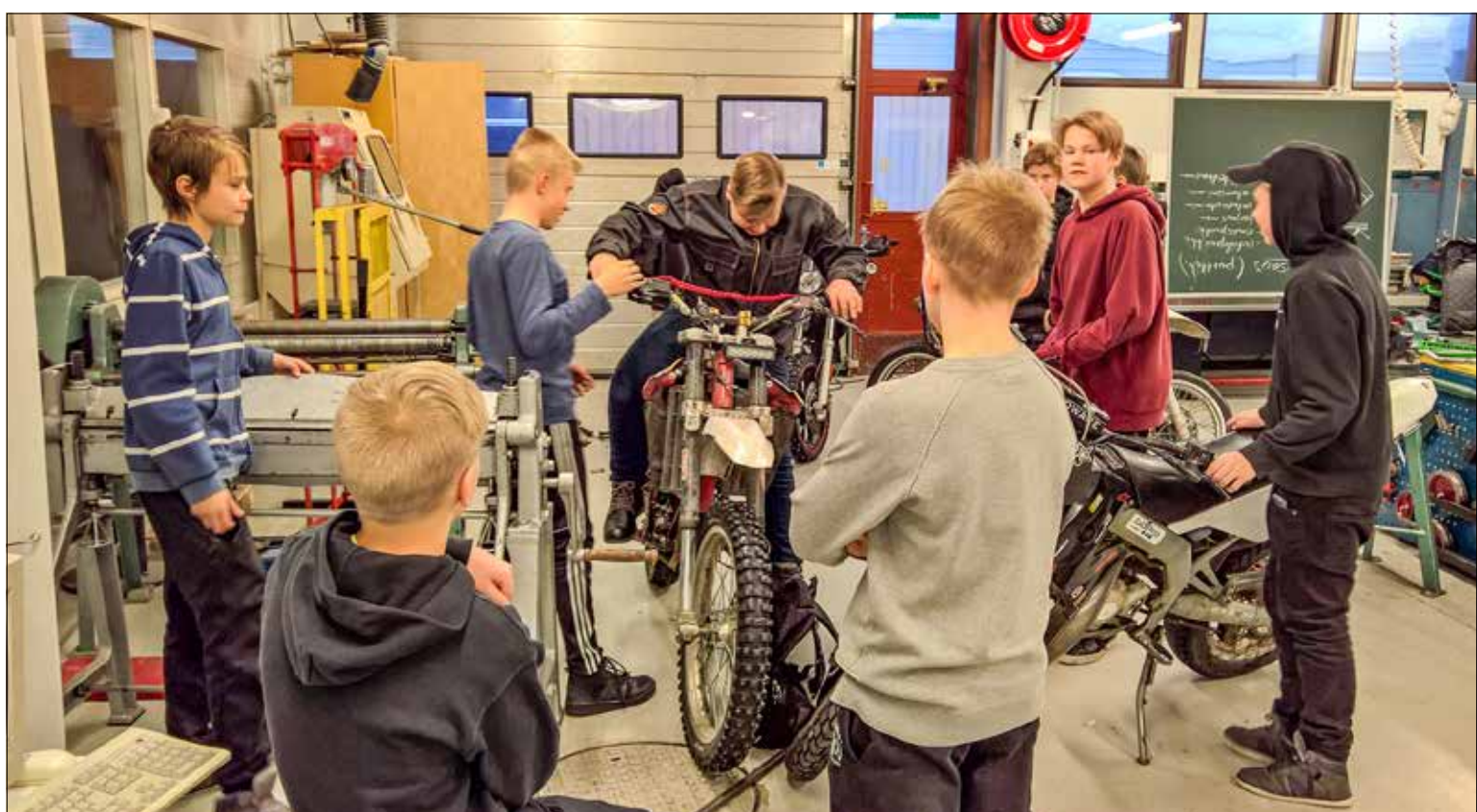
Monille kerhon pojille ohjattu kerhotoiminta antaa eväitä tulevaa ammatillista koulutusta ja myös elämää varten.

Komulaisen mielestä on hienoa, että viikoittaisten iltojen aikana pojat oppivat mopojen tekniikkaa, korjausta ja maalausta. Yhtä tärkeänä hän pitää sitä, että mopokerhossa kehittyvät myös nuorten erilaiset yhteistyötaidot ja toisten huomioiminen.