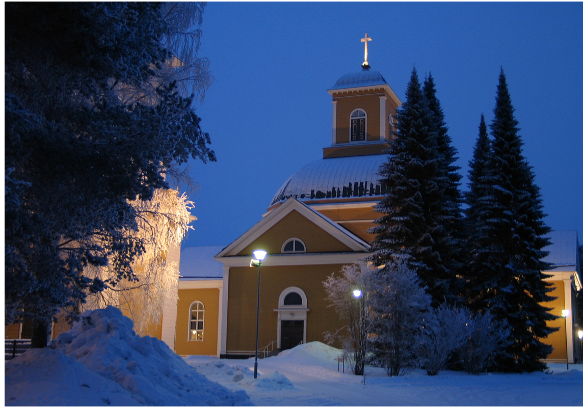
Uusi kirkkovuosi alkaa 1. adventista. Kuhmon kirkko kutsuu mukaan moniin adventin ja joulunajan tilaisuuksiin.

Ajattelle, miten hyvä Jumala meillä on; tänäänkin tarjotaan minulle ja sinulle pääsyä jäseneksi taivaalliseen perheväkeeseen. Tänäänkin tarjotaan minulle ja sinulle tätä kaikkea armosta, ilmaiseksi, lahjana. Voi-